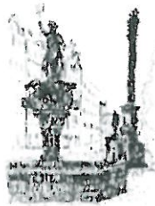
Rynek Fontanna z Neptunem